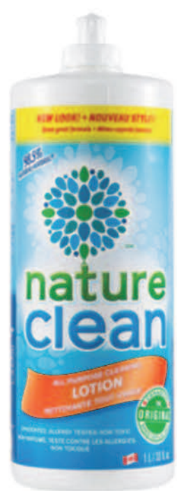
Lotion nettoyante tout usage — 1 L — Non parfumée

Ayez une maison propre et étincelante. Tous nos produits de nettoyage ménager assurent un nettoyage en profondeur à l'aide d'ingrédients naturellement dérivés, tout en étant doux pour vous et l'environnement.