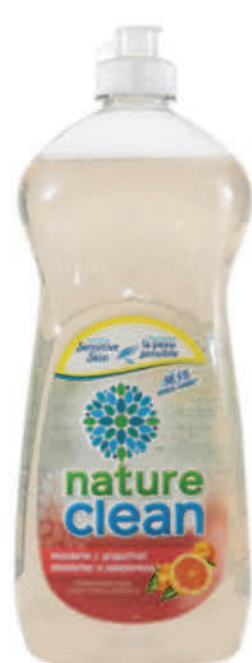
Savon à vaisselle liquide — 740 ml — Mandarine et pamplemousse