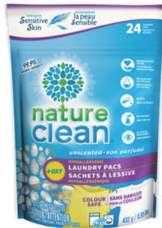
Sachets à lessive — 24 sachets — Non parfumés