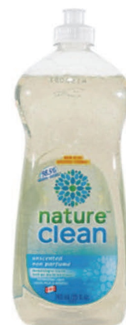
Savon à vaisselle liquide — 740ml — Non parfumé