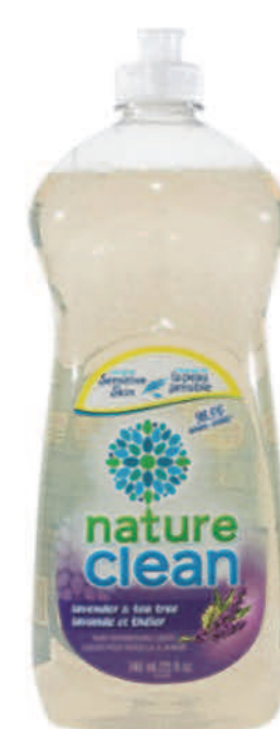
Savon à vaisselle liquide — 740ml — Lavande et arbre à thé