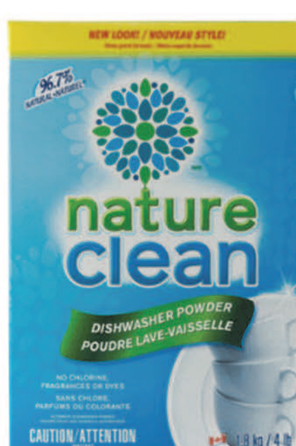
Poudre lave-vaisselle — 1,8 kg —