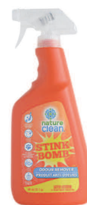
Désodorisant à vaporiser — 740 ml —