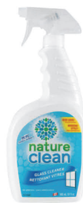
Nettoyant à vitres — 946 ml —