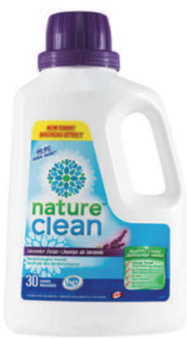
Détergant à lessive liquide — 1,8 L — Lavande

LE SAVIEZ-VOUS ? SI VOUS AVEZ UNE LAVEUSE MALODORANTE, DÉPOSEZ-Y UN SACHET DÉSODORISANT ET FAITES-LA FONCTIONNER VIDE AVEC DE L'EAU CHAUDE.