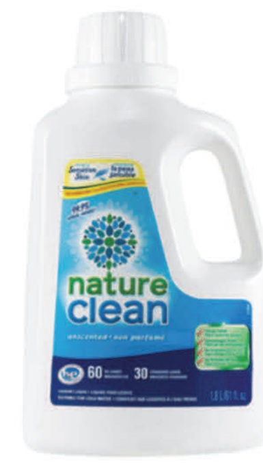
Détergant à lessive liquide — 1,8 L — Non parfumé