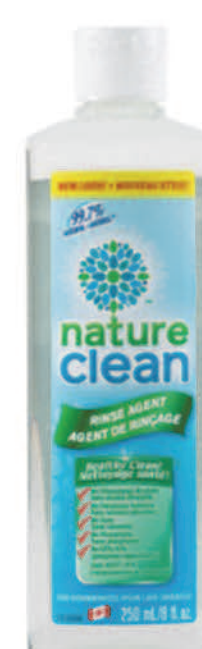
Agent de rinçage pour lave-vaisselle — 250 ml —