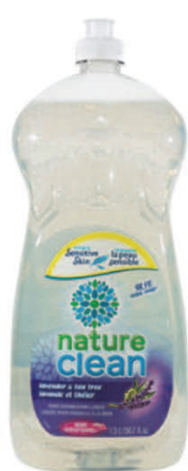
Savon à vaisselle liquide — 1,5 L — Lavande et arbre à thé