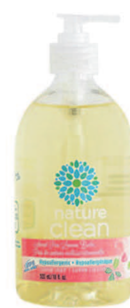
Savon à mains liquide — 500 ml — Baume au pois de senteur citronné