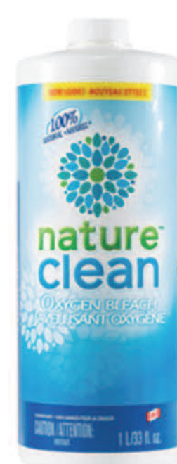
Javellisant oxygène liquide — 1 L —