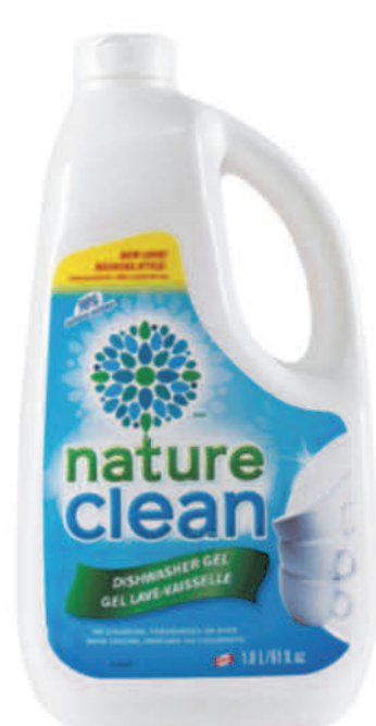
Gel lave-vaisselle — 1,8 L —

Nous avons tout ce qu'il faut pour voir à vos besoins en matière de soins pour la vaisselle. Notre gamme de produits pour la vaisselle conserve votre vaisselle impeccable sans utiliser de produits chimiques toxiques. Et quand il s'agit de votre peau, nous ne vous dirons pas que nos produits sont doux. Nous le prouverons ! Tous nos produits pour les soins de la vaisselle ont été testés cliniquement comme étant non irritants.