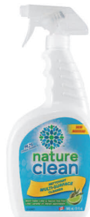
Nettoyant concentré multisurface — 946 ml — Lime et arbre à thé

NOTRE CRÈME NETTOYANTE POUR BAINS ET CARREAUX NETTOIE TRÈS BIEN LES SURFACES DE CUISSON EN VERRE.