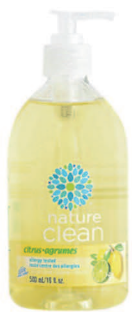
Savon à mains liquide — 500 ml — Agrumes

Si vous recherchez des produits de soins personnels non irritants et respectueux de l'environnement, n'allez pas plus loin. Tous nos produits de soins personnels sont doux pour la peau et écologiques.