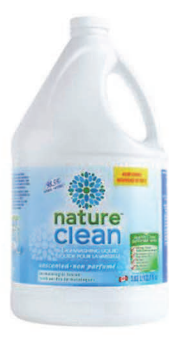
Savon à vaisselle liquide — 3,63 L — Non parfumé