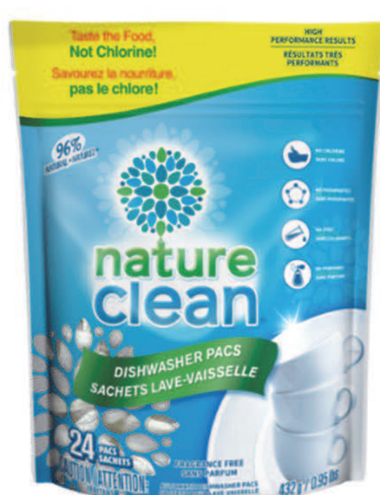
Sachets lave-vaisselle — 24 sachets —