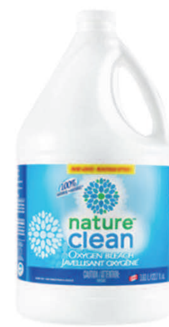
Javellisant oxygène liquide — 3,63 L —