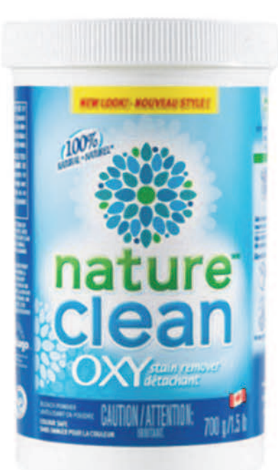
Oxy détachant en poudre — 700 g —