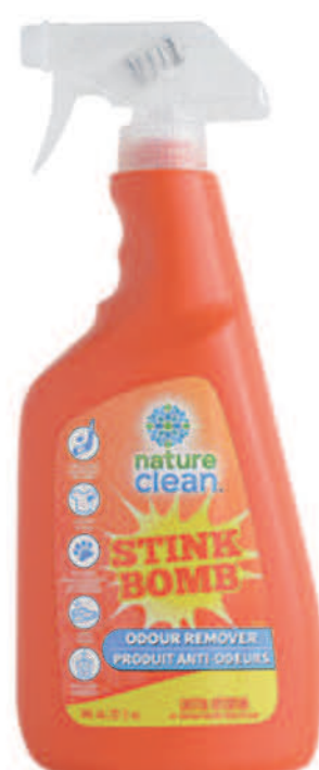
Désodorisant à vaporiser — 740 ml —