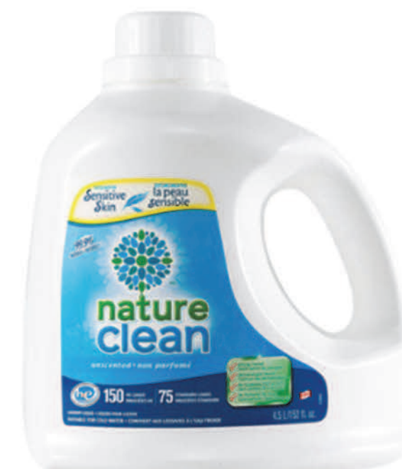
Détergant à lessive liquide — 4 L — Non parfumé