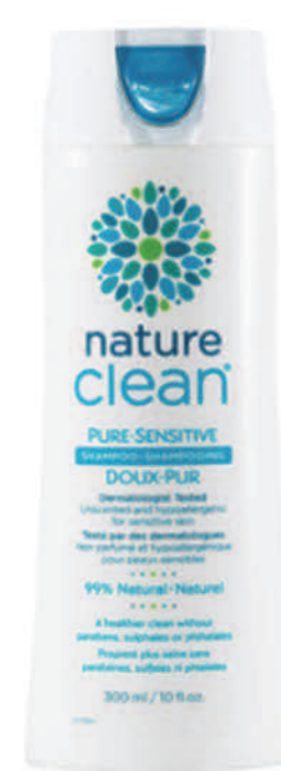
Shampooing Pure-Sensitive — 300 ml — Non parfumé