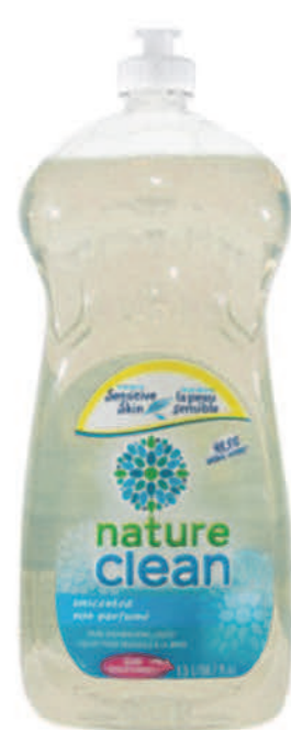
Savon à vaisselle liquide — 1,5 L — Non parfumé