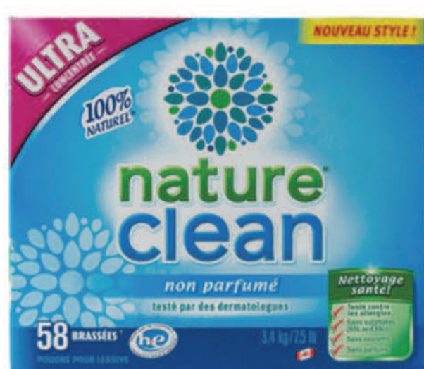
Savon à lessive en poudre — 3,4 kg — Non parfumé