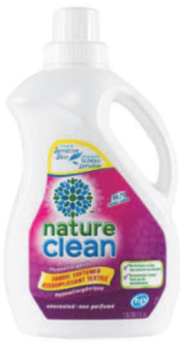
Assouplissant textile — 1,5 L — Non parfumé

Nous ne pouvons rendre la lessive amusante, mais nous pouvons la rendre plus saine ! Bien que la plupart des produits utilisent des produits chimiques de synthèse potentiellement dangereux, nos produits de buanderie ne sont pas toxiques et sont exempts de produits chimiques nocifs, tout en restant efficaces contre les taches et doux sur votre peau et pour vos vêtements. Nos produits de buanderie sont les meilleurs.