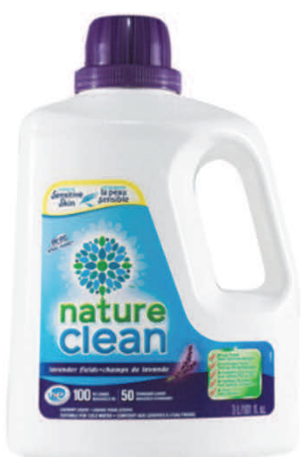
Détergant à lessive liquide — 3 L — Lavande