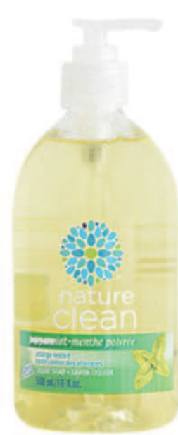
Savon à mains liquide — 500 ml — Menthe poivrée