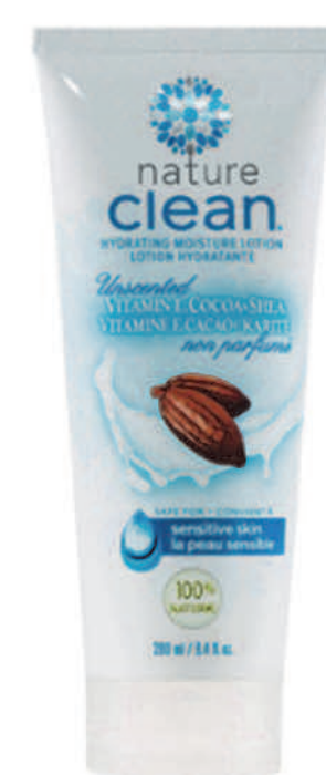
Lotion hydratante — 280 ml — Non parfumé

LE SAVIEZ-VOUS? NOTRE REVITALISANT POUR CHEVEUX SENSIBLES EST UNE EXCELLENTE CRÈME À RASER POUR PERMETTRE UN RASAGE DOUX ET SOYEUX.