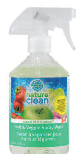
Nettoyant à vaporiser pour fruits et légumes — 500 ml —