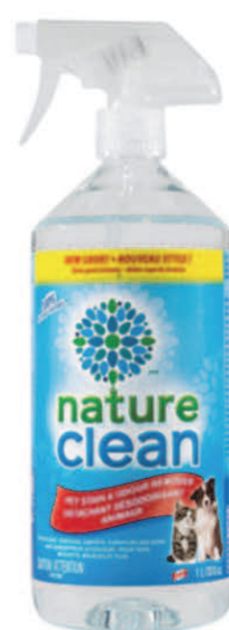
Nettoyant et désodorisant pour animaux — 1 L —