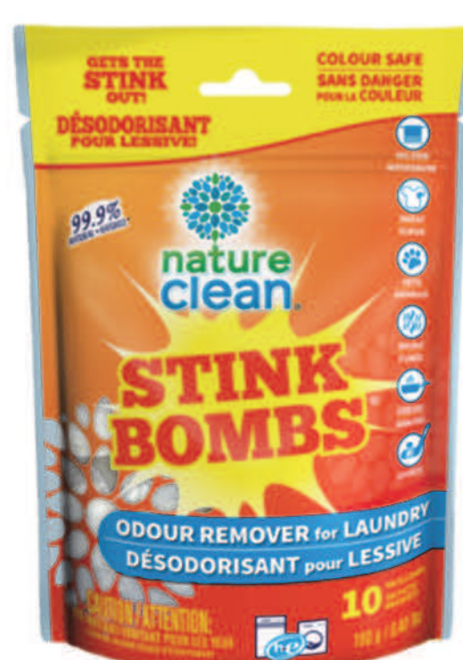
Sachets désodorisants — 10 sachets —