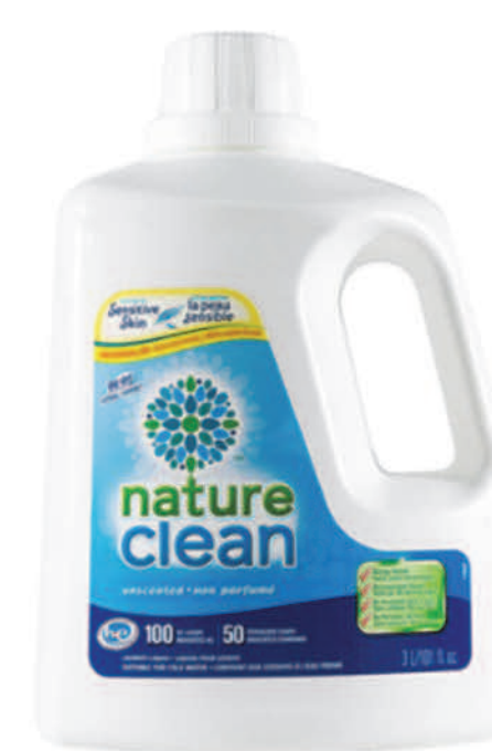
Détergant à lessive liquide — 3 L — Non parfumé

LE SAVIEZ-VOUS ? SI VOUS AVEZ UNE LAVEUSE MALODORANTE, DÉPOSEZ-Y UN SACHET DÉSODORISANT ET FAITES-LA FONCTIONNER VIDE AVEC DE L'EAU CHAUDE.