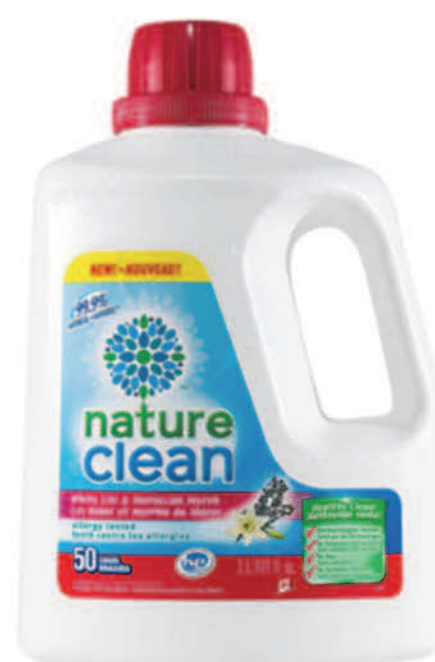
Détergant à lessive liquide — 3 L — Lys blanc et myrrhe marocaine