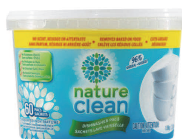
Sachets lave-vaisselle — 60 sachets —