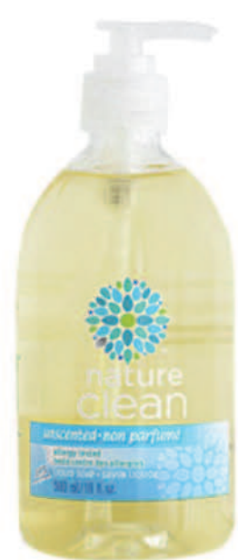
Savon à mains liquide — 500 ml — Non parfumé

LE SAVIEZ-VOUS? NOTRE REVITALISANT POUR CHEVEUX SENSIBLES EST UNE EXCELLENTE CRÈME À RASER POUR PERMETTRE UN RASAGE DOUX ET SOYEUX.