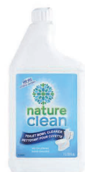
Nettoyant pour cuvettes — 1 L —