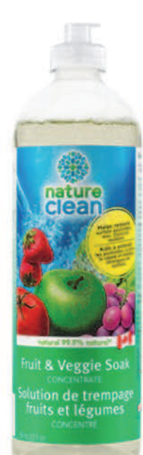
Concentré pour trempage fruits et légumes — 700 ml —

Nettoyez-les avant de les manger ! Il est alarmant d'apprendre les mauvaises choses auxquelles les fruits et légumes frais que nous aimons pourraient être exposés. Même les produits biologiques! La plupart des pesticides ne peuvent pas être éliminés par l'eau seule. Notre nettoyant à vaporiser pour fruits et légumes frais et notre solution de trempage utilisent une formule naturelle qui facilite l'élimination de vilains résidus, des contaminants, de la cire, des germes et de la saleté des fruits et légumes frais.