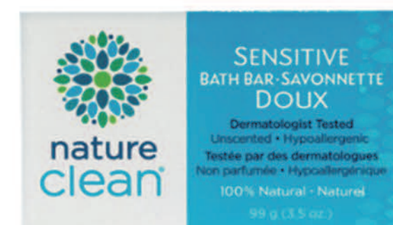
Savonnette pour peau sensible — 99 g — Non parfumée