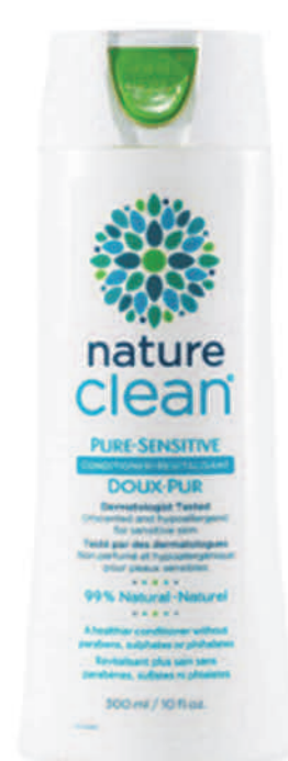
Revitalisant Pure-Sensitive — 300 ml — Non parfumé